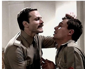
1975 LA MARCHÉ TRIOMPHALE (Marcia trionfale) de Marco Bellocchio avec Michele Placido