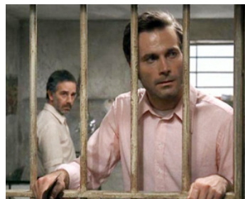
1971 NOUS SOMMES TOUS EN LIBERTÉ PROVISOIRE (L'istruttoria è chiusa) de D. Damiani avec R. Cucciola