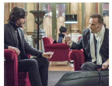
2017 JOHN WICK 2 (John Wick, chapitre 2) de Chad Stahelski avec Keanu Reeves