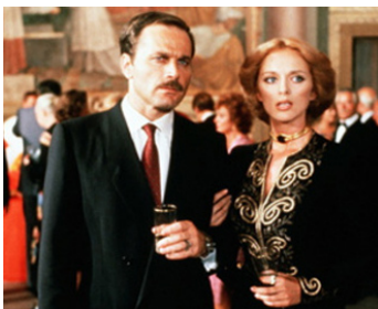
1980 LA SALAMANDRE (The Salamander) de Peter Zinner avec Sybil Danning