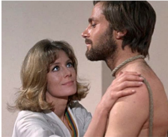
1968 UN COIN TRANQUILLE À LA CAMPAGNE (Un tranquillo posto...) d'Elio Petri avec V. Redgrave