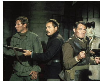
1977 L'OURAGAN VIENT DE NAVARONE (Force 10 from Navarone) de G. Hamilton avec H. Ford, R. Shaw