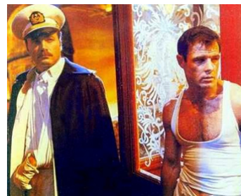
1982 QUERELLE (Querelle) de Rainer Werner Fassbinder avec Brad Davis