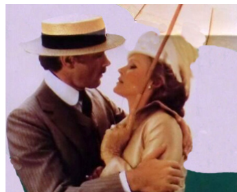
1981 MEXICO EN FLAMMES (Krasnyie kolokola) de Sergueï Bondartchouk avec Ursula Andress