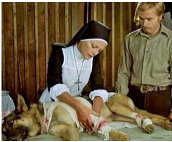
1973 CROC-BLANC (Zanna Bianca) de Lucio Fulci avec Virna Lisi