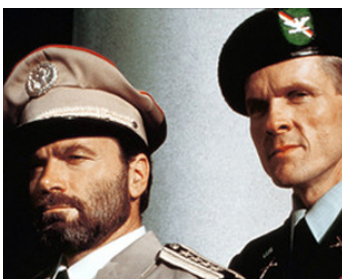
1990 58 MINUTES POUR VIVRE (Die hard 2) de Renny Harlin avec William Sadler