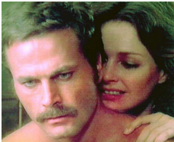
1975 LES MAÎTRES (Gente di rispetto) de Luigi Zampa avec Jennifer O'Neill