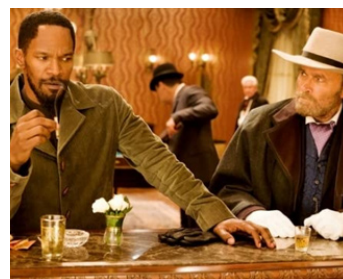
2012 DJANGO UNCHAINED de Quentin Tarantino avec Jamie Foxx