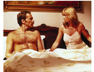
1981 L'IMPLACABLE NINJA (Enter the Ninja) de Menahem Golan avec Susan George