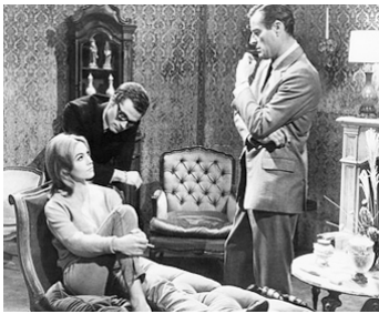
1965 TECHNIQUE D'UN MEURTRE (Tecnica di un omicidio) de F. Prosperi avec J. Valérie, R. Webber