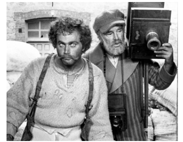
1974 CIPOLLA COLT (Il Cipollaro) d'Enzo G. Castellari avec Sterling Hayden