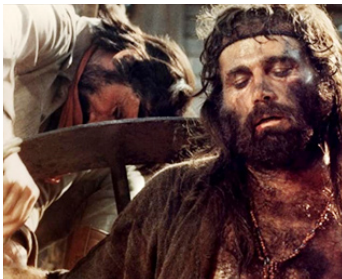
1976 KEOMA (Keoma il Vindicatore) d'Enzo G. Castellari avec Giovanni Cianfriglia