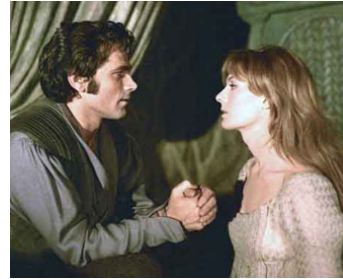
1967 CAMELOT (Camelot) de Joshua Logan avec Vanessa Redgrave