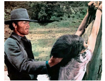
1966 TEXAS ADDIO (Texas, addio) de Ferdinando Baldi avec Silvana Bacci