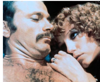
1976 LES MAGICIENS de Claude Chabrol avec Stefania Sandrelli