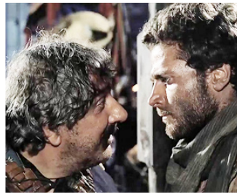
1966 DJANGO (Django) de Sergio Corbucci avec José Bodaló