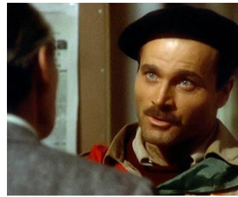
1973 LES DERNIERS JOURS DE MUSSOLINI (Mussolini, ultimo atto) de C. Lizzani avec Lino Capolicchio