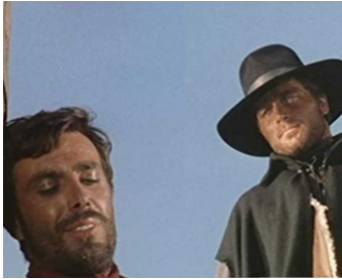
1966 LE TEMPS DU MASSACRE (Tempo di massacro) de Lucio Fulci avec George Hilton