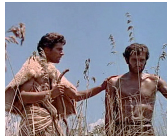
1966 LA BIBLE (The Bible) de John Huston avec Richard Harris