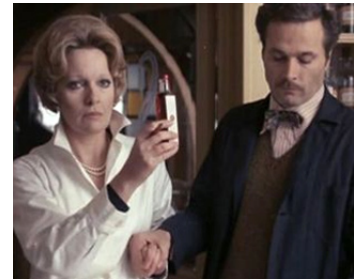
1976 SCANDALO (Scandalo) de Salvatore Samperi avec Lea Gastoni