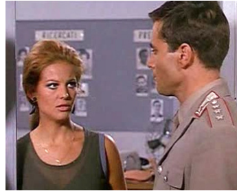
1967 LA MAFIA FAIT LA LOI (Il Giorno della civetta) de Damiano Damiani avec C. Cardinale