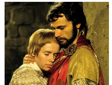
1972 JEANNE, PAPESSE DU DIABLE (Pope Joan) de Michael Anderson avec Liv Ullmann