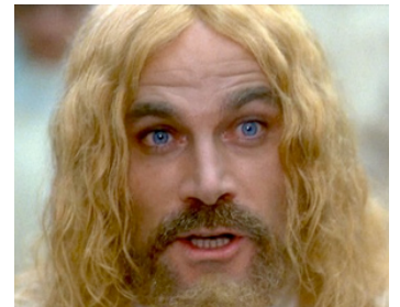
1978 LE VISITEUR MALÉFIQUE (Stridulum) de Giulio Paradisi