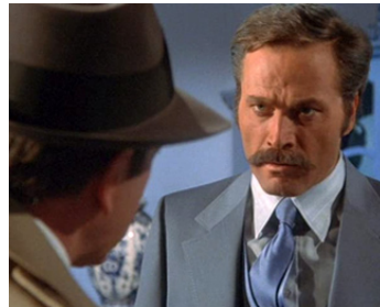
1979 DÉTECTIVE COMME BOGART (The Man with Bogart's Face) de R. Day avec R. Sacchi