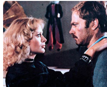
1980 COBRA (Il Giorno del Cobra) d'Enzo G. Castellari avec Sybil Danning