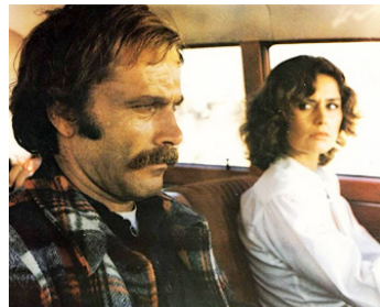
1977 LA PROIE DE L'AUTOSTOP (Autostop rosso sangue) de P. Festa Campanile avec Corinne Cléry