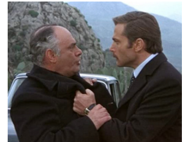
1971 CONFESSION D'UN COMMISSAIRE DE POLICE de D. Damiani avec Martin Balsam