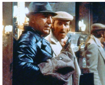
1972 LE SALOPARD (Senza ragione) de Silvio Narizzano avec Telly Savalas