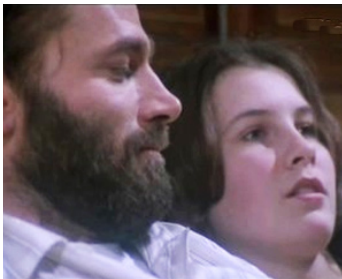
1980 UN DRAME BOURGEOIS (Un Drama borghese) de F. Vancini avec Laura Wendel