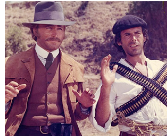
1970 COMPANEROS (Vamos a matar, compañeros) de Sergio Corbucci avec Tomas Milian