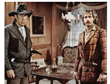
1973 LOS AMIGOS (Deaf Smith & Johnny Ears) de Paolo Cavarra avec Anthony Quinn