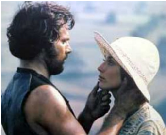
1970 LA VIERGE ET LE GITAN (The Virgin and the Gypsy) de Christopher Miles avec Joanna Shimkus