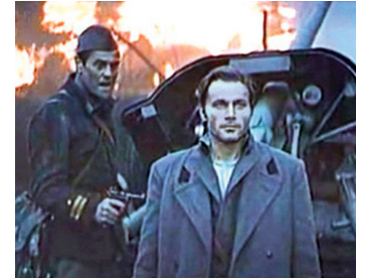
1969 LA BATAILLE DE LA NERETVA (Battle of Neretva) de Vjekoslav Bulajic avec Oleg Vidov