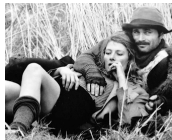
1971 LA VACANZA (La Vacanza) de Tinto Brass avec Vanessa Redgrave