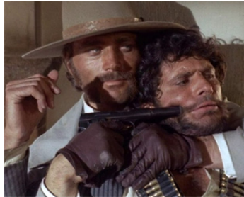
1968 LE MERCENAIRE (Il Mercenario) de Sergio Corbucci avec Tony Musante