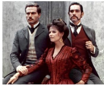
1973 LUCIA ET LES GOUPAPES (I Guappi) de P. Squitieri avec C. Cardinale, Fabio Testi