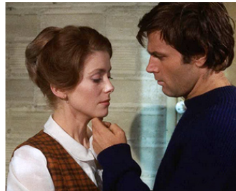
1970 TRISTANA (Tristana) de Luis Buñuel avec Catherine Deneuve