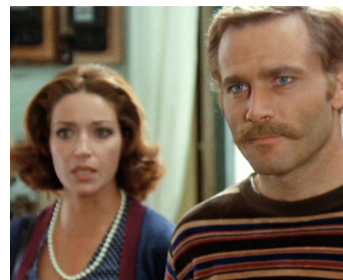
1972 COMMENT TUER UN JUGE ? (Perché si uccide un magistrato) de D. Damiani avec Françoise Fabian